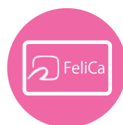
● 会員証 (FeliCa カード)

当スクールは、すでにお持ちのフェリカカード (Suica・PASUMO など) を会員証としてご登録いただけます。