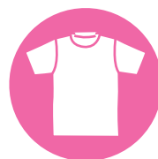
● 運動のできる服装